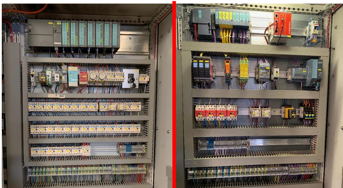
Figure 1 : À gauche ; avant la modernisation / à droite après la modernisation

Comme cette chaudière fonctionne principalement comme une sécurité intégrée à la chaudière à copeaux de bois, la conversion a dû être planifiée en détail. Grâce à la plaque de montage préfabriquée, la conversion et la mise en service ont été réalisées en quatre jours.