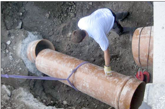
2. Interrompre le tuyau