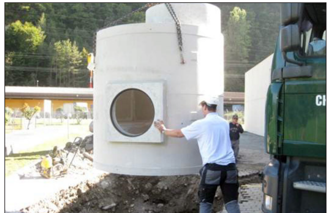
3. Positionner le puits