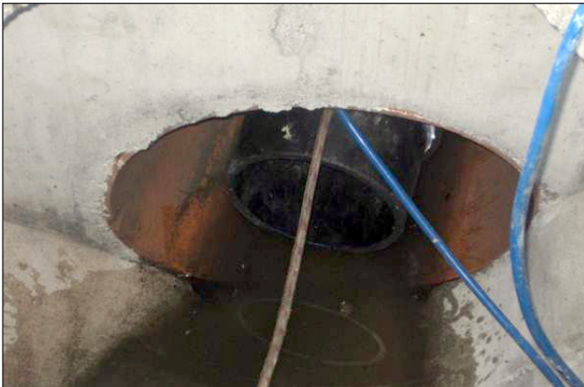
1. Poser le soufflet d'arrêt