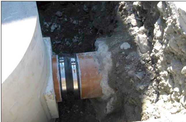
4. Assembler le tuyau et le manchon, enlever le soufflet d'arrêt