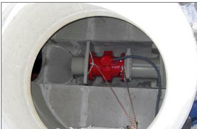
6. Poser le câble et le raccorder