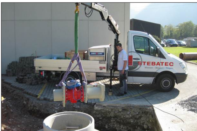
5. Monter l'appareil de mesure