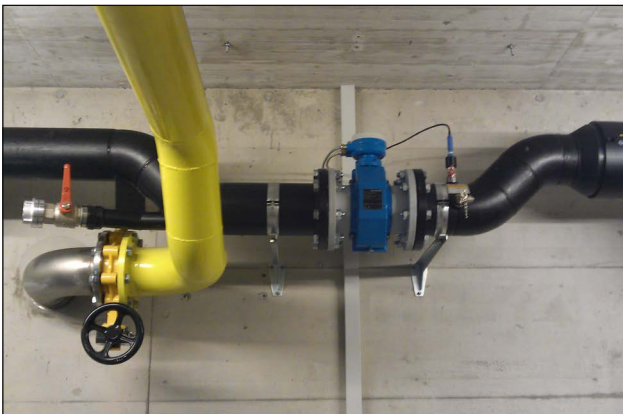
Mesure de débit stationnaire NW150 installée au niveau de la sortie de la canalisation.