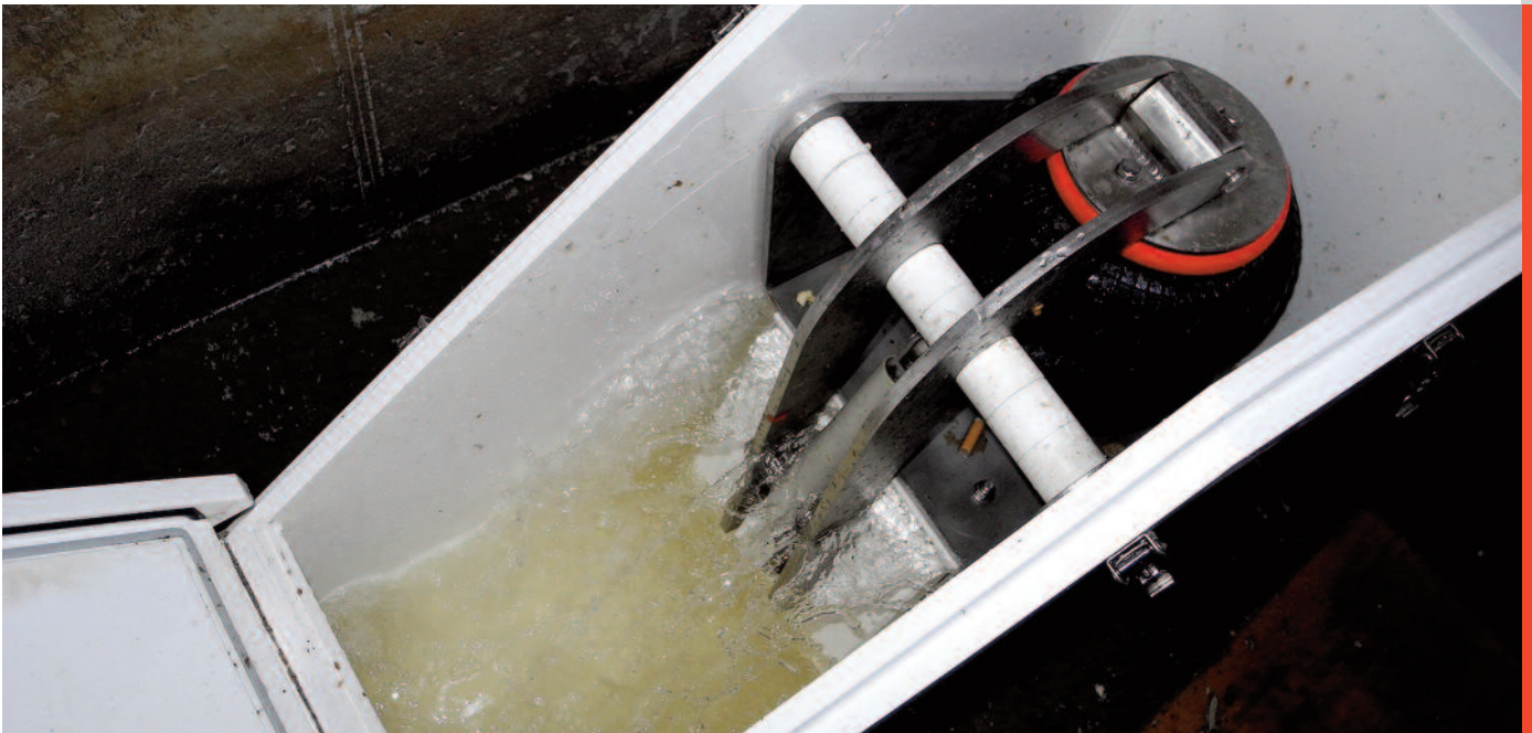
La nouvelle régulation pneumatique du débit à remplissage partiel du BEP d'Erlet avec regard de service ouvert.