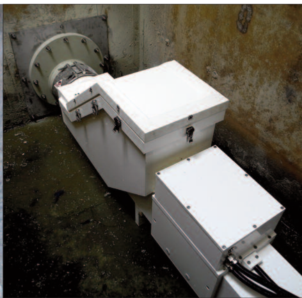
La régulation pneumatique du débit à remplissage partiel, montée à sec, dans le même regard, permettant de mesurer également le débit.