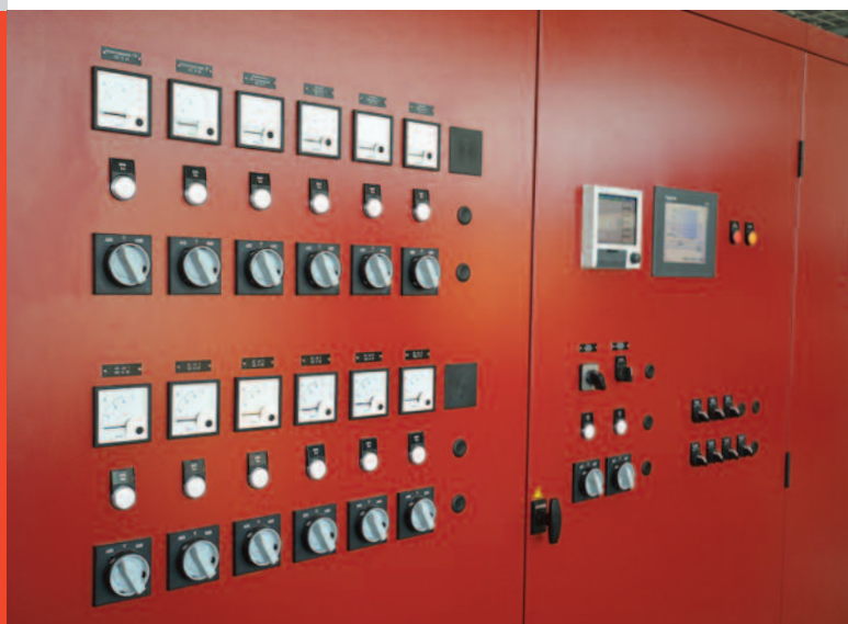
Vue détaillée de la nouvelle distribution principale.

séparation peut subitement monter par temps de pluie. Pour simplifier le fonctionnement de l'exploitation et pour limiter le coût, des nouvelles buses d'air sont installées pour le nettoyage du bassin. Celles-ci retiennent les matières solides en suspension dans le bassin et empêchent ainsi leur sédimentation. Important pour la sécurité du travail, la nouvelle installation de ventilation qui, dans la zone ATEX associée à un nouvel éclairage, garantit un environnement sûr. Par ailleurs, la climatisation du local technique a été optimisée énergétiquement. Et enfin, une nouvelle vanne de régulation commande, en fonction du niveau de remplissage du bassin, le volume d'eau à acheminer vers la station d'épuration.