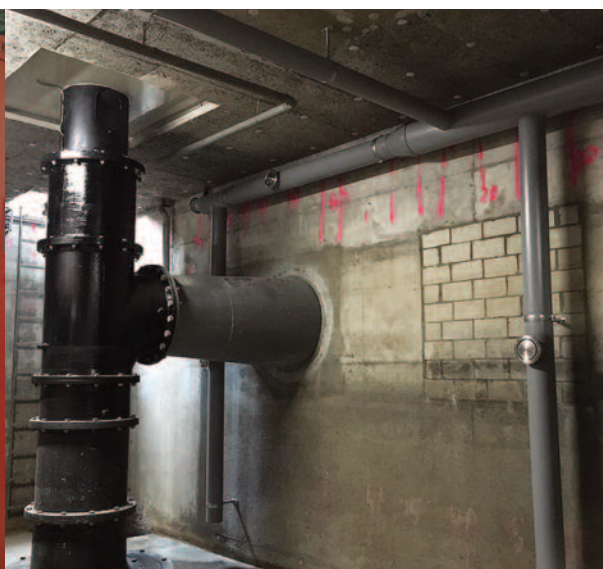
Dans la zone ATEX, une nouvelle installation de ventilation garantissant des conditions sécurisées (tubes gris sur le mur et le plafond).