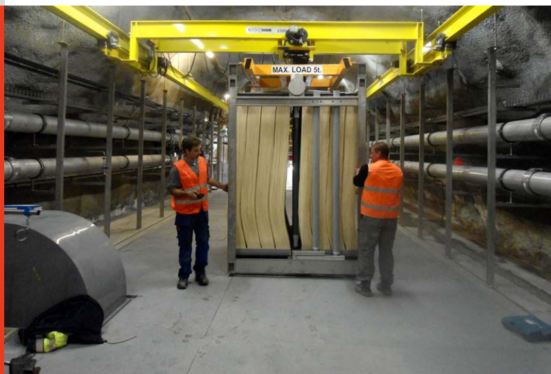
Transport eines Teils für das neue Membranbiologieverfahren (© Ryser Ingenieure AG).

Vor der eigentlichen Sanierung wurde die Betriebszentrale auf den neusten Stand gebracht, um eine sichere Grundlage für alle weiteren Arbeiten zu schaffen. In den touristisch weniger ausgelasteten Sommerhalbjahren wurde 2012 und 2013 jeweils eine Abwasserstrasse stillgelegt und komplett erneuert. Die biologische Reinigung erfolgt aus Platzgründen nicht mehr im Belebtschlamm-, sondern im Membranbiologieverfahren; die in Zermatt eingesetzte Fläche von über 32'000 m 2 stellt gar den Landesrekord dar. Wichtig während des Umbaus war eine sichere Lüftung: Die Abbrucharbeiten in den Kavernen waren staubig und die Gase der ARA gefährlich. Alles musste zudem zerlegt werden, um die engen Stollen auf Elektrofahrzeugen oder an der eigens installierten Kranbahn bis zum Ausgang passieren zu können. Der hohe Einsatzwille und die Flexibilität der STEBATEC zahlten sich aber aus, ist sie für Zermatt heute doch der erste Ansprechpartner nicht nur für die Elektroplanung, sondern für die ganze Steuer- und Messtechnik.