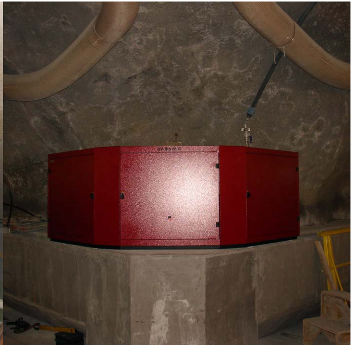
Aufgrund der Platzverhältnisse waren Spezialanfertigungen gefragt, wie dieser Schaltschrank in einer Y-Verzweigung der Kaverne.