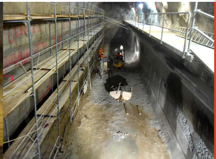
Die Ausbrucharbeiten erfolgten mit Elektrobaggern.