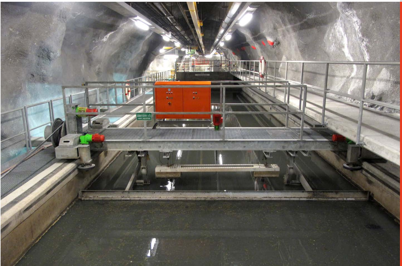
Die Kläranlage Zermatt ist aus Platzgründen komplett unterirdisch in Felskavernen angelegt.