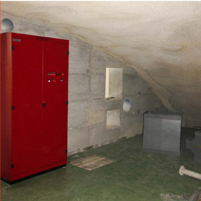
Einer von vielen dezentralen Steuerschränken.