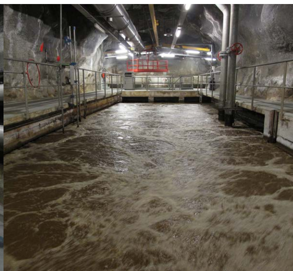
Das Belebtschlammbecken der alten biologischen Reinigungsstufe.