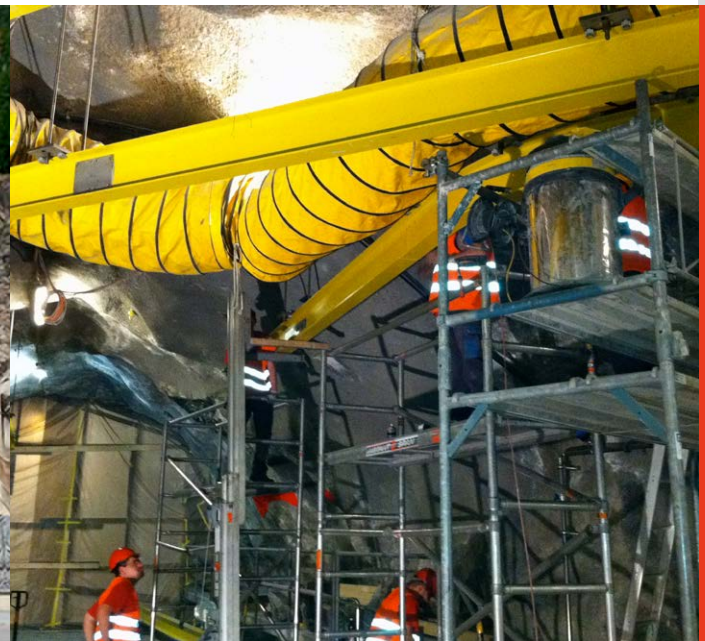
Ein ganz wichtiger Bestandteil der Arbeiten unter Tage war eine zuverlässige Belüftung.