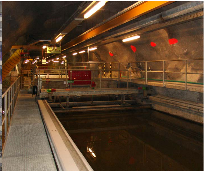
Die Vorklärräumerbrücke wurde revidiert und mit neuer elektrischer Ausrüstung versehen.