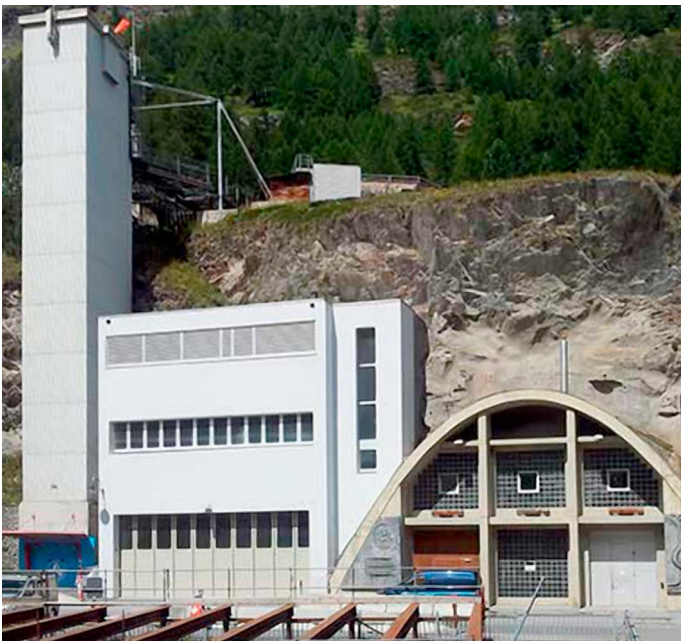
Von aussen sichtbar sind nur der Neubau mit der Schlammbehandlung und das Eingangsportaal, der ganze Rest der ARA liegt im Berg.